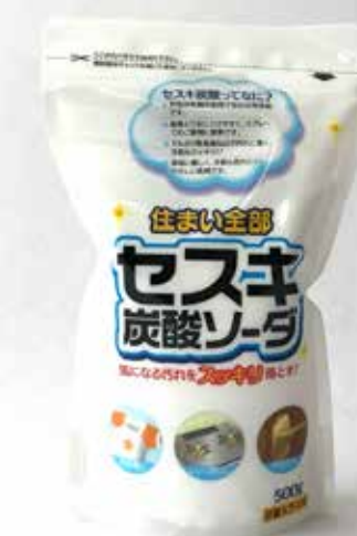
セスキ炭酸ソーダ