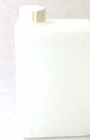
アルカリイオン水